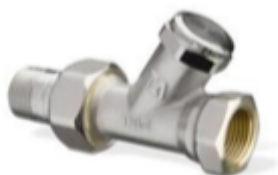
Bild 1. Visar en Raditrim A

Ny anslutning mellan VV och VVC samt ny reglerventil installeras i badrummet (ej i schakt). Demontering och alternativ anslutning VVC visas på bild 2 .